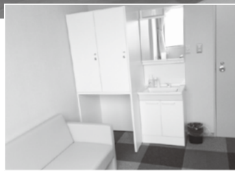
シングルルームの洗面台