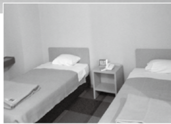
特別ツインルーム