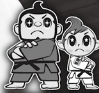
東建柔道キャラクター 剛介&剛太