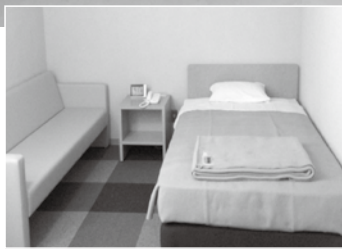
特別シングルルーム